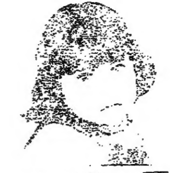
مقال نعيم جبران